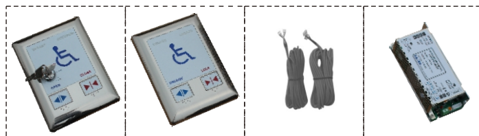
外面板 内面板 6、7拼插线 主控制器